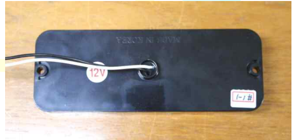
시험품(전면, 16개 광원)