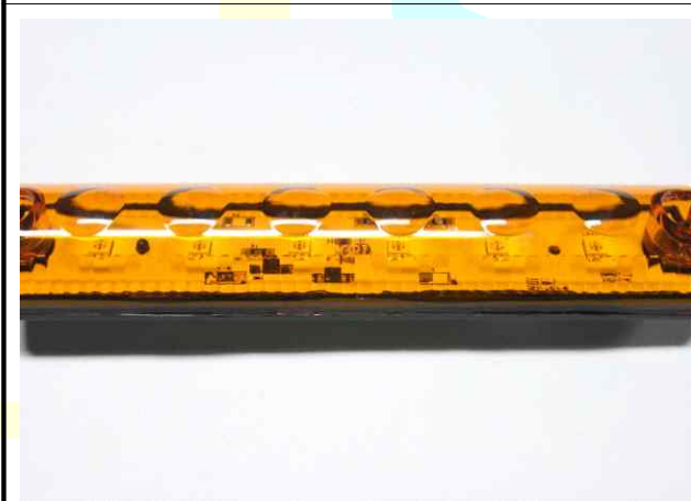
각인/기호 렌즈 ( SORI )